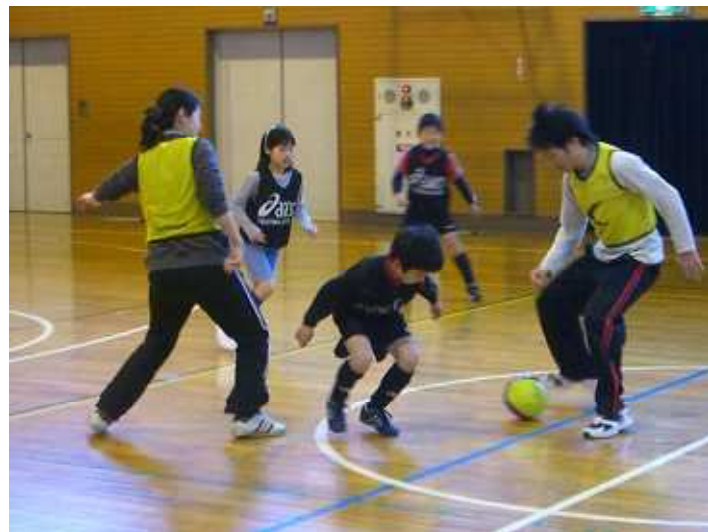
(華麗な足さきを見せる児童館職員チーム)