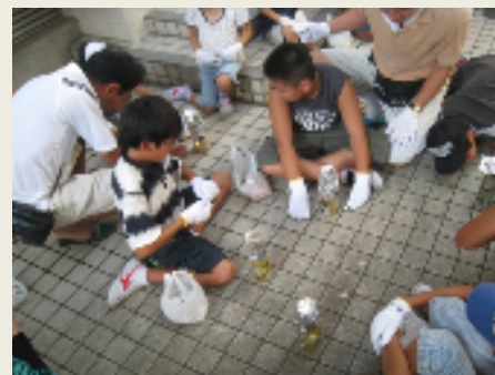
空き缶で飯炊き体験しました！